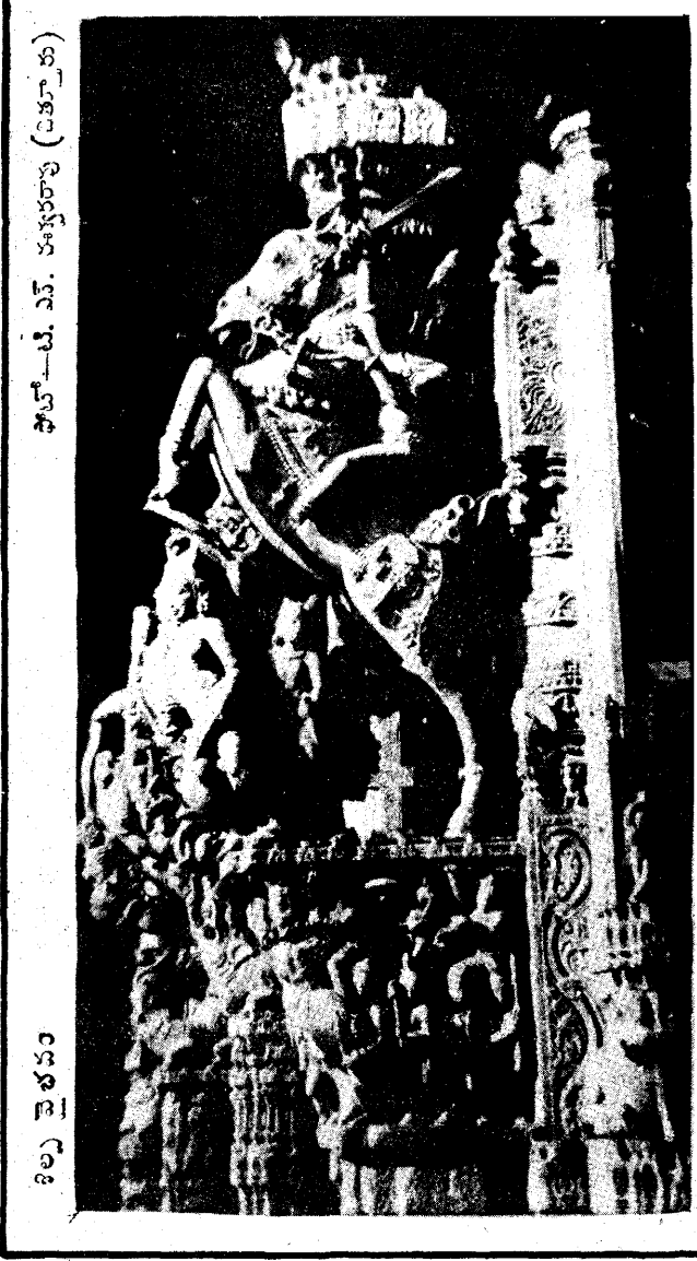
కానల్య మూటలు (కానల్య)

మధ్యాహ్నం పోస్టల్లో ఉత్తరం వచ్చింది నాకు. లీల వ్రాసింది. "వాన్న గారికి మళ్ళీ హార్ట్ ఎలాకే వచ్చింది. అందరం చాలా భయపడ్డాం. దేవుడి దయవల్ల అంతా సర్దుకుంది. ఇప్పుడు కొంచెం కులాసాగానే ఉన్నారు. బాగా రెప్ప తీసుకోమన్నారు డాక్టరు. పెద్ద స్వయ్య ఈ నెలొకటికి రవ్వ వెలుతున్నాడు. తన ఆనారోగ్యం కారణం గానూ, పెద్ద స్వయ్య వెళ్ళిపోతున్నాడని ఈ నెలొకటిగా నా పెళ్ళి చేసివ్వాలని నాన్నగారు చాలా పట్టుపట్టారు. ఆయన దృష్టి ఎప్పటినించో మా దూరపు బంధువుల్లో ఒకతని మీద ఉంది. ఆ సంబంధమే స్థిరపరచుకుని వచ్చారు. నా మాట వినిపించుకునే స్థితిలో ఎవరూ లేరు. ఆలోచించు కునేందుకు కూడా వచ్చని వా కివకుండా