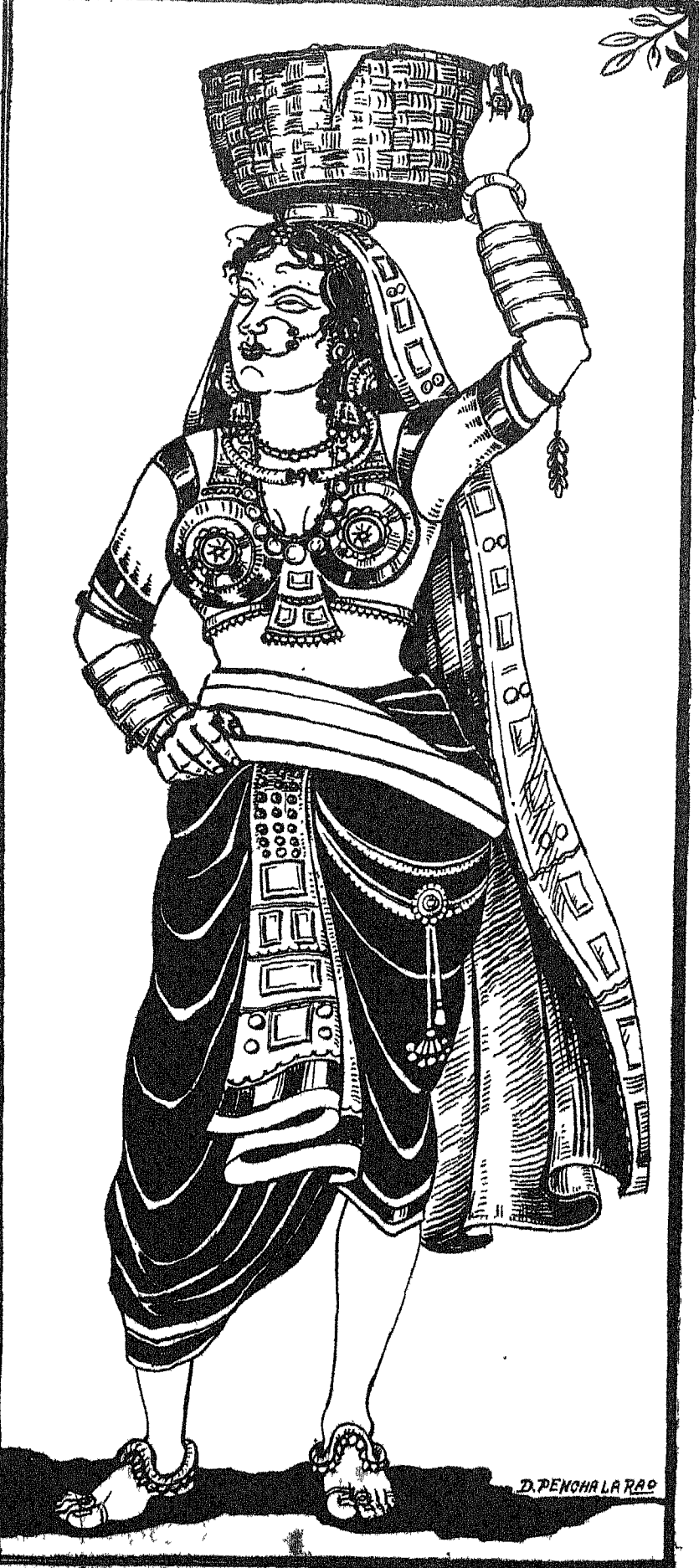
“పచ్చి యమ్ము పళ్ళు” చిత్రం—ద్రోణాధుల పెంచలధావు

“అచిమీ! నీవెంత మంచిదానివి అచిమీ! నా బతుక్కి సుక్కానివి అచిమీ! ఇక నాకు బయం లేదు! ఈ సరకానికి దూరంగా, పారగానికి దగ్గరగా రా ఎల్లసోదాం. రాలచిమీ! కడసారిగా ఈ పూరికి, ఈ మామిడి తోటకు దండంపెట్టు! సిస్టతనంనుంచీ వీరకతంతో కంసిపోయిన అచిమానాన్ని, సేమను కడిగిపోయేకో! కట్టలు