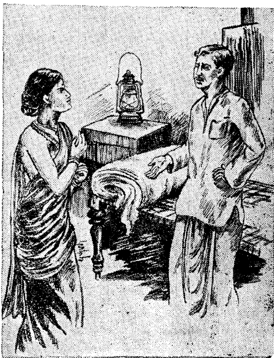
‘వెయ్యనని ఎవ్వరు చెప్పారు’

“అయితే నువ్వు పక్కవెయ్యవన్నమాట?” “వెయ్యనని ఎవ్వరుచెప్పారు?”