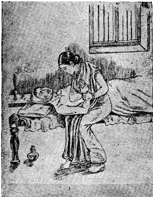
‘తన రెండుచేతులమధ్యా.....మెల్లిగా పట్టుకుంది.’

అందరూ పోయిన తరువాత సుందరమ్మ భర్తపాదాలను ఒత్తుతూ మంచమీద కూర్చుంది. అవినభాగితములగు నామె నేత్రములు కృశీభూతమైన భర్తవదనమువంక తడేకధాన్యంగా చూస్తున్నాయి. స్వర్ణనుగ్రహించి విశ్వనాథం కళ్లు విప్పిచూశాడు. ఇద్దరి దృష్టులును నిశ్చలంగా కలుసుకోడానికదే మొదటిసారి. సుందరమ్మ అతని తల దగ్గరికి జరిగివచ్చింది. తన రెండుచేతులమధ్యా భర్తహస్తాన్ని మెల్లిగా