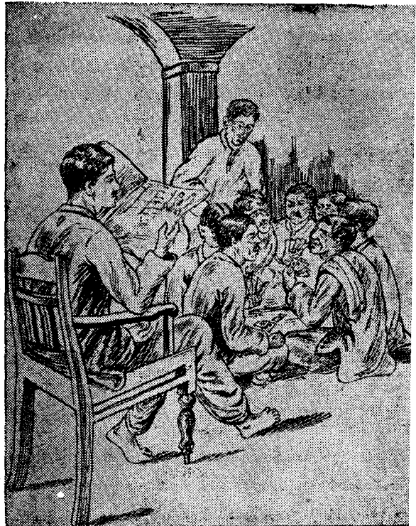
‘ఇల్లా కుప్పీమీదమాచుని పేషరు చూసుకుంటానులే.’