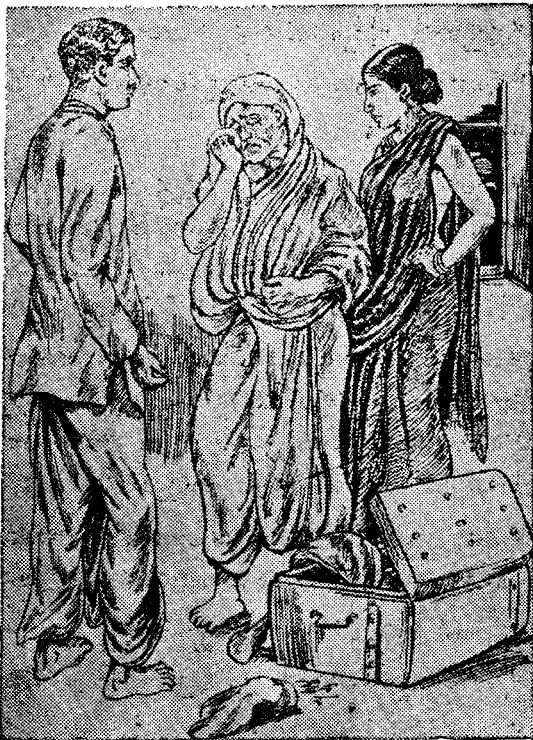
“ఏం చెయ్యవసాబూ... చీవాట్లు తింటూ ఉంటాను”

సుందరమ్మ మాటాడలేదు. లోపలినుంచి అతని అత్తగారు వచ్చి ట్రంకుపెట్టెలోని బట్టలు తియ్యడం మొదలుపెట్టింది. విశ్వ నాథ మామెను అడ్డుకుని “ఏమండోయ్! దీనితో లక్షసార్లు చెప్పాను మీకు ఆనవసరంగా యిలాటి వ్యవహారాల్లో కలగచేసుకోవద్దని ఆ విడ బట్టలు యెండుకు ముట్టుకోద్దో చూస్తాను. మీరు దూరంగా వుండండి. ప్రతిదానికి మీరిల్లా సిద్ధపడబట్టే రోజుకిరోజూ ఆవిడసితి మరింత అర్థాన్నమై పోతూంది” అన్నాడు.