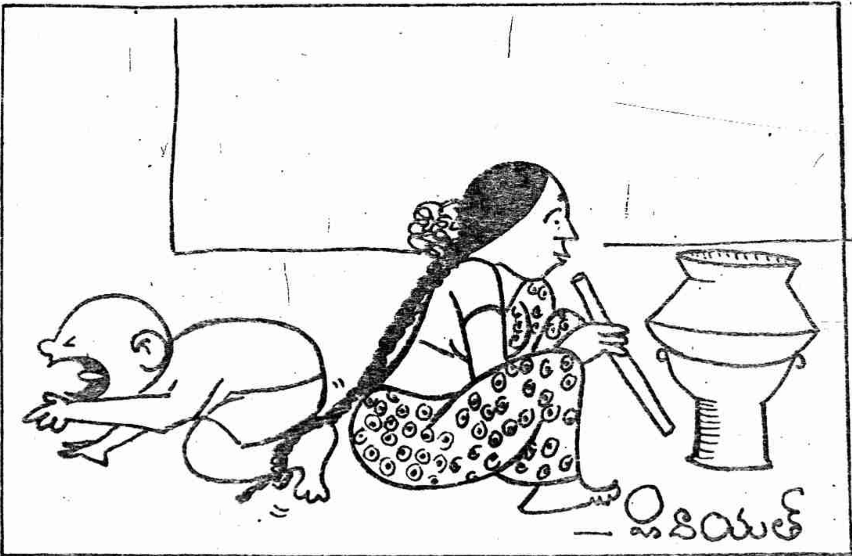
'అమృత్ కిరణ్' కార్టూన్స్ పాటిల్ కన్సోలేషన్ బహుమతి పొందిన కార్టూన్

ప్రిన్సిపాల్ అప్పుడు చెప్పిన మొత్తం కూడా ఆమె శక్తికి మించిందే. అయినా ఆమె అంగీకరించింది.