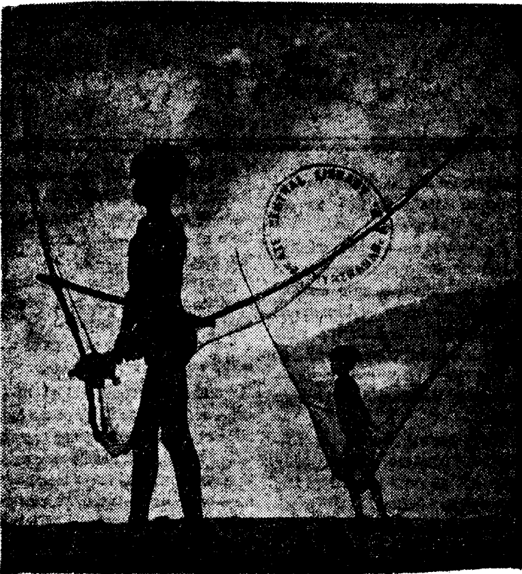
"వ ల జీ వు లు" —యస్. ఆజాద్