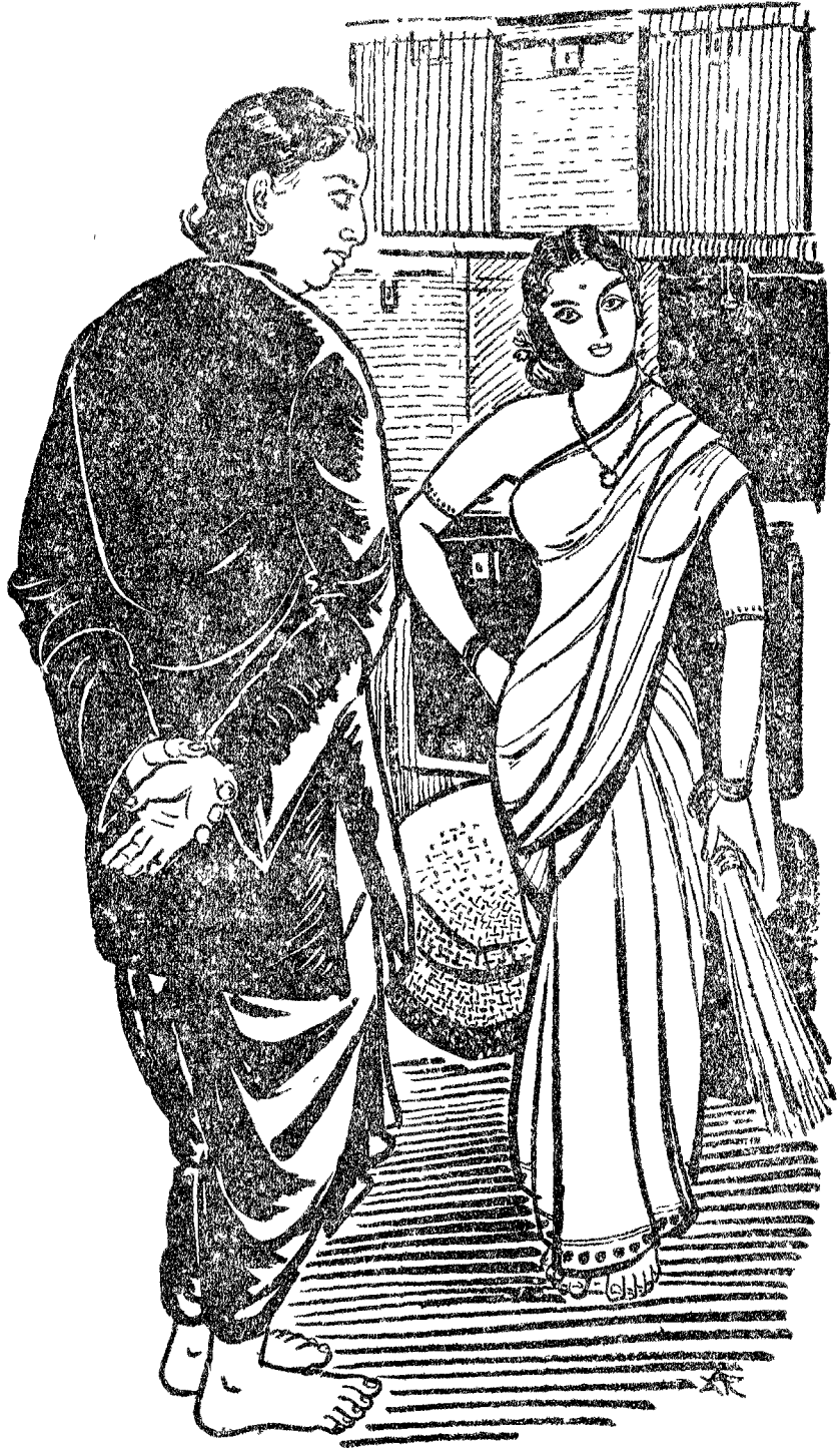
"మీరనేదమిటో నా కర్ణం కావటంలేదు."

"అడదానయినా కేకే ఒంటరిగా పని చేసుంటే? ఏమింటి, ఏవరంచేయగలరు, విమాతుందింటే? ఏమిండ్లోయి- ఒక కిక్కి డబ్బు బలంవుంటే, యింకోకేకే మాటబలం వుంటుంది. ఒక కిక్కి కిక్కివుంటే, యింకో రికే యిక్కివుంటుంది. అలాగే- మీ మగా