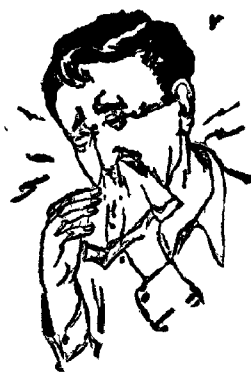
అబ్బ! ఒకే జలుదు...వారము...

వికాల తండ్రి మరళి అటు రావడం చూసి లోపలికి ఆ హ్వనించి కూర్చో వున్నాడు. లోపలికి పోయినప్పడు కూతు రుతో "మాకానా అమ్మయ్యా, ఆ అబ్బాయి రాజాలా ఉన్నాడు. అతని సంబంధం తీసుకువస్తే అది కాదన్నావు" అన్నారు. "ఏ సంబంధం" అని ఆ అబ్బాయి కేసి చూసింది. మరళి! తన మరళి! "ఈ సం బంధ మెప్పడూ వాలో చెప్పండే!" అంది.