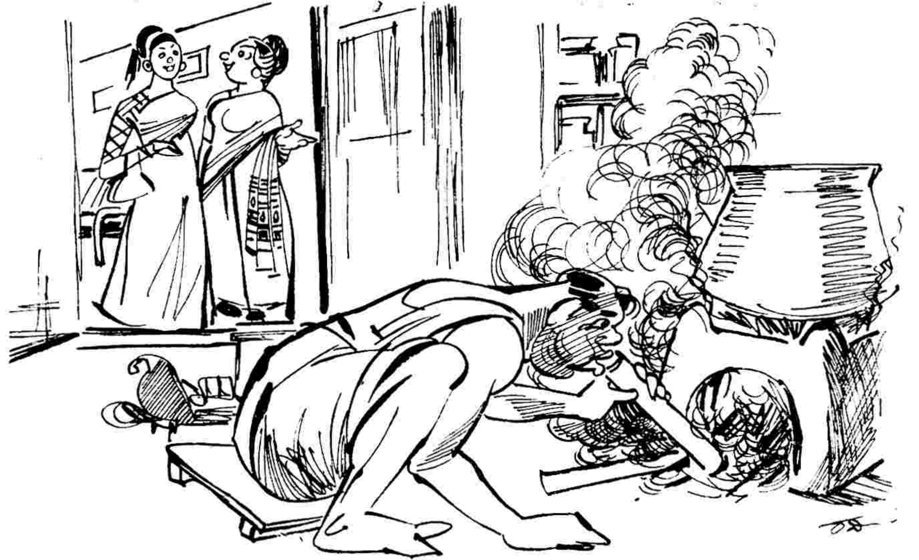
"నౌకరు కాదు, నా భర్త! లేబరు యూనియన్ సెక్రటరీ."

ఏమీ అనలేదు. లేచి వెళ్ళిపోదా మనిపించినా, అతనికి మనస్సులో కలవరంగా వుండేమోనని కూర్చుండి పోయింది.