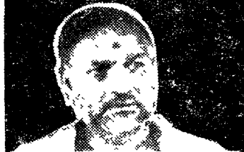
అలత్రంపై మహిళలకు ప్రత్యేకంగా ఆకర్షణీయమైన హాట్ ఫుంటుంబి వివరాలు వచ్చేసంబకలో!